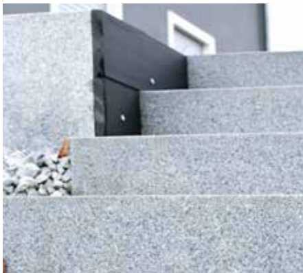
Granit-Blockstufe Cristallo Grey