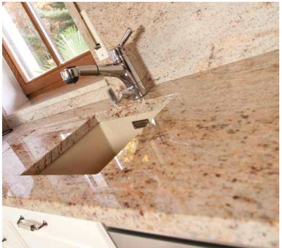
Granit Ivory Brown