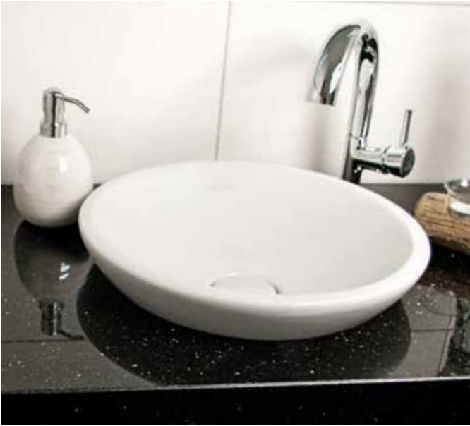
Waschtischplatte Star Galaxy