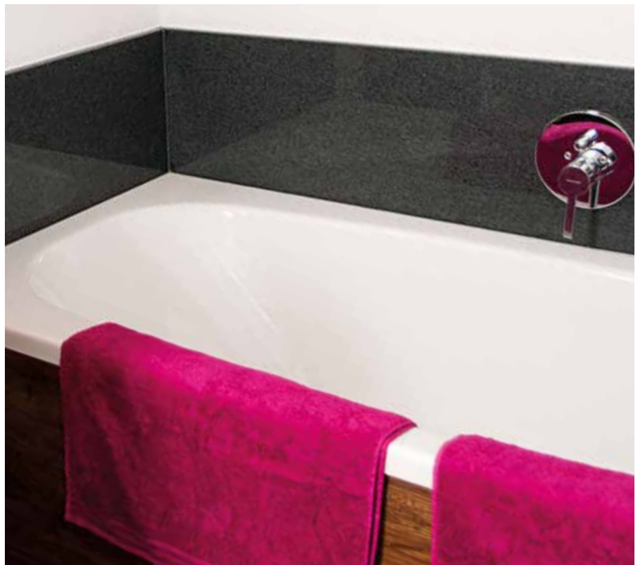
Wandplatte Impala Grey