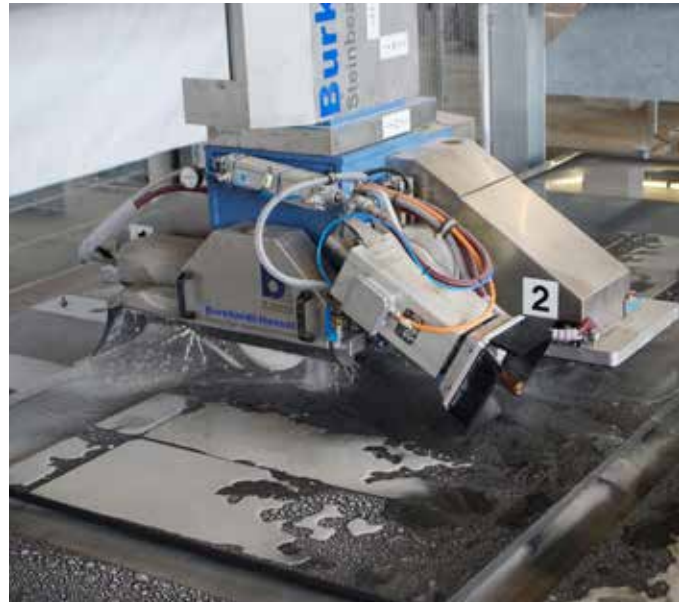
Hochmoderne Anlagen garantieren höchste Präzision in der Fertigung

Bei allen Produkten legt Bachl großen Wert auf die qualitativ hochwertige Verarbeitung der Natursteinerzeugnisse. Jedes gefertigte Exemplar wird daher einer genauesten Endkontrolle unterzogen.