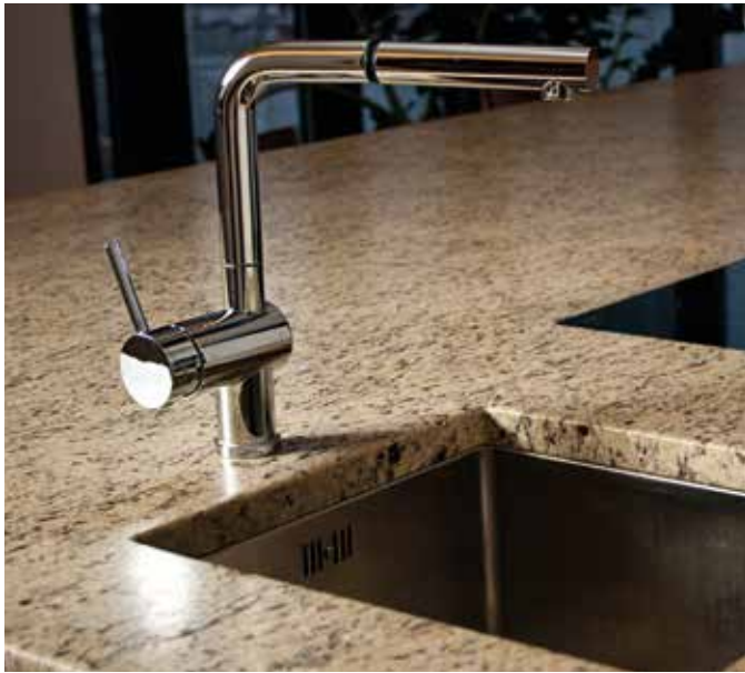
Granit Giallo Firenze