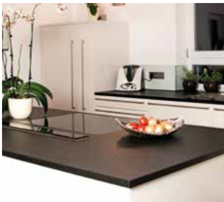
Granit Nero Assoluto patiniert