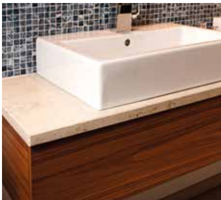
Waschtischplatte Jura gelb